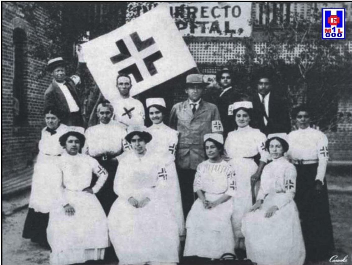
Foto 4 Personal del Hospital Insurrecto dirigido por el Dr. Ira Bush teniente coronel del Cuerpo Médico del Ejército Libertador (6)

Además de curar a los soldados heridos en combate, las enfermeras se enfrentaban a otras enfermedades, muchas de ellas consecuencia de la mala alimentación y poca higiene en la tropa. Los soldados morían por heridas de bala, y muchos otros caían infectados por las epidemias como el tifus y la fiebre amarilla.