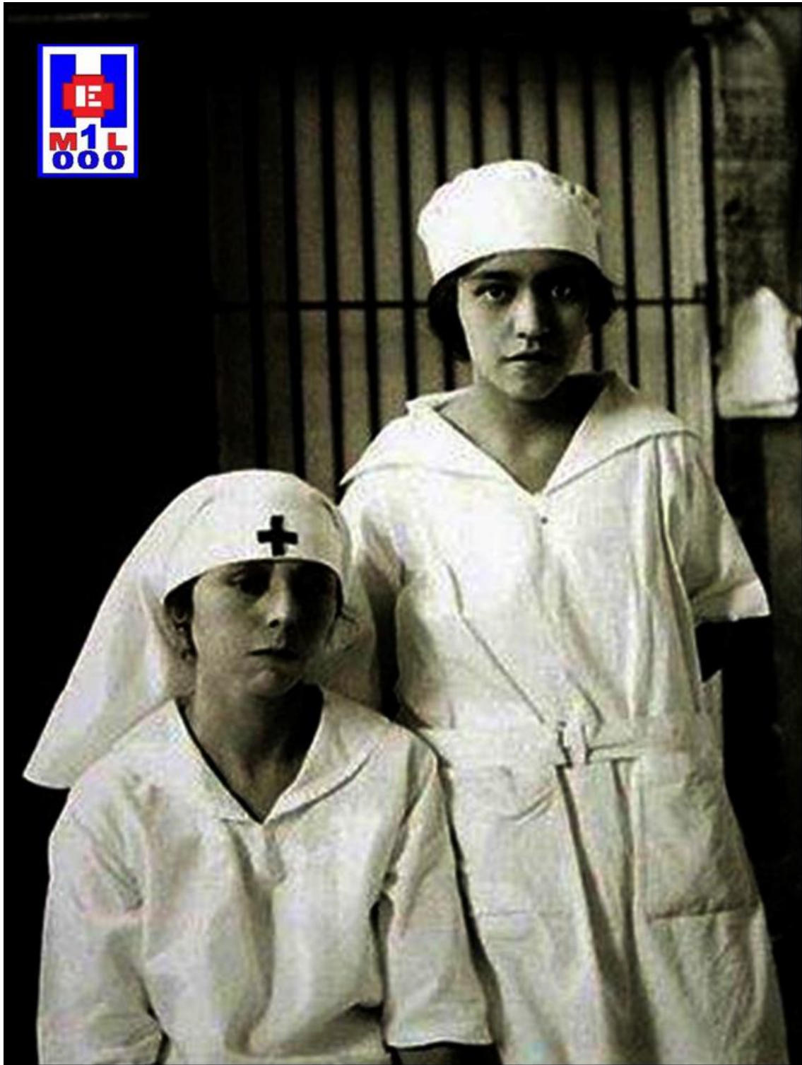
Foto 11 Enfermeras de Monterrey, Estado de Nuevo León, México