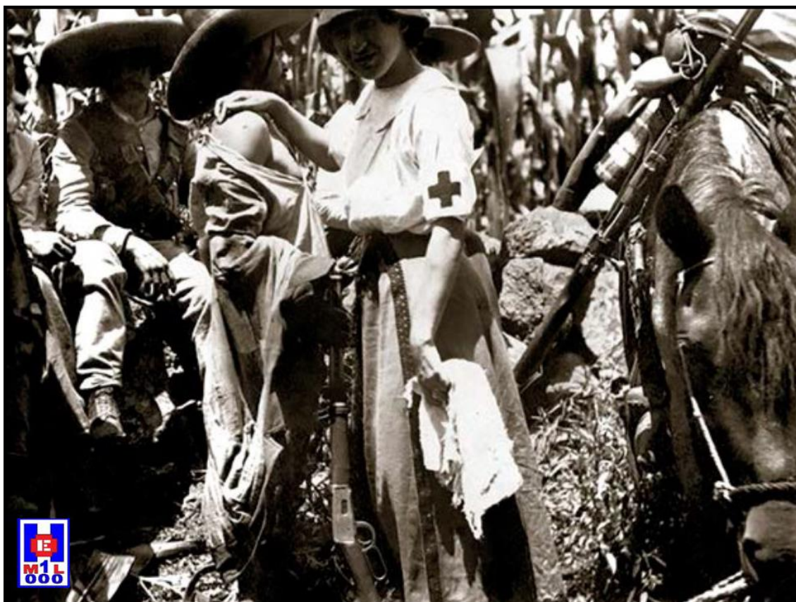
Foto 10 Enfermera de la Cruz Roja curando a una mujer herida en el campo de batalla. Secretaría de Cultura, México, 1912

12.- Las enfermeras de la Cruz Blanca de la revolución Mexicana. Lunes, 24 de julio de 2017 http://divertimentoenfermero.blogspot.com/2017/07/las-enfermeras-de-la-cruz-blanca-de-la.html